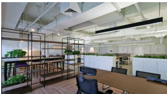
福建新日空投資諮詢有限公司事務所内