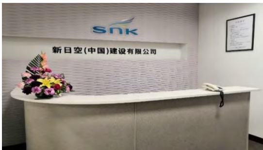
中国現法新社名看板